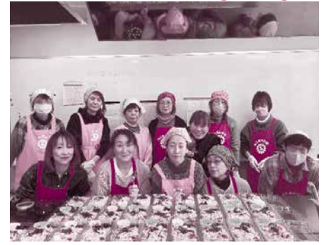
▲2/2 独居高齢者お楽しみ昼食会 (ボランティア協力：商工会女性部の皆さん)