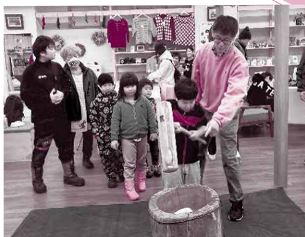
▲1/20 ふれあいカフェ2023 (もちつき体験)