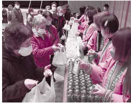
▲12/1 独居・高齢夫婦おたのしみ会 (ボランティア協力：JA士幌女性部の皆さん)