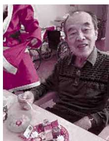
▲12/20・25 特別養護老人ホーム すみれ棟・さくら棟・ひまわり棟の3棟 それぞれでクリスマス会（参加149名）