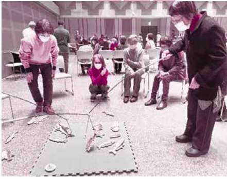
▲11/9 独居高齢者おたのしみ会 (ボランティア協力：西町公民館女性部の皆さん)