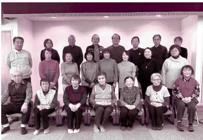
北地区ふれあいサロン(平成20年2月開設) 毎月15日開催 / 北地区集落センター