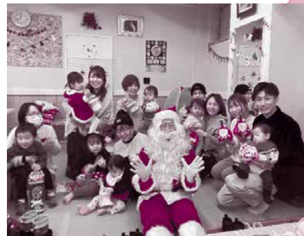
▲12/16 ふれあいカフェ2023 (読み聞かせ後にサンタさん登場！)