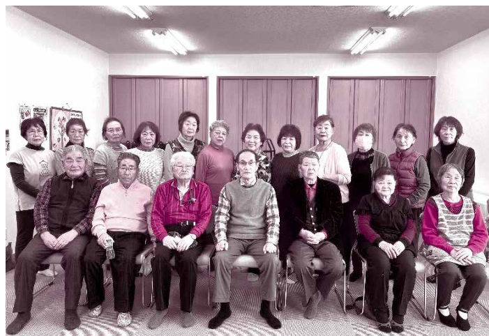
北町きらくサロン(平成20年9月開設) 毎月第2木曜日 / 愛風会内地域交流室(なごみ)