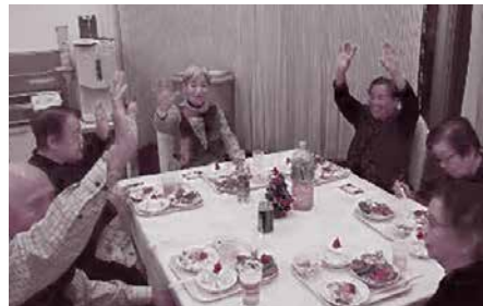
▲12/25 ケアハウスしほろ愛風苑 クリスマス会（参加50名）