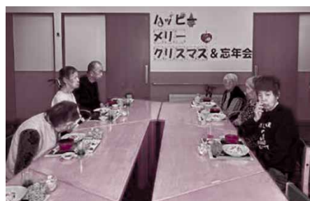
▲12/24 グループホームひまわり・ 笑顔クリスマス会（参加24名）