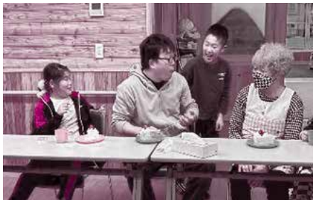
▲12/18 すずらんの家 クリスマス会（参加18名）

改めて、歳末たすけあい募金活動にご協力いただきました皆様に心より感謝を申し上げます。