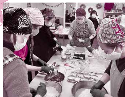
▲1/20 ふれあいカフェ2023 (もちつきボランティアの皆さん)