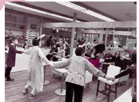
▲12/16 ふれあいカフェ2023 (もりの音楽会～クリスマスコンサート)