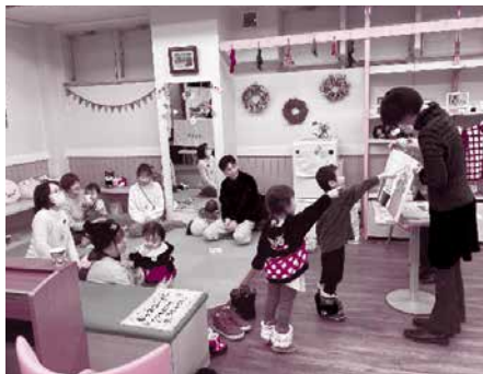
▲12/16 ふれあいカフェ2023 (読み聞かせ：児童書を読む会あんばんまん)