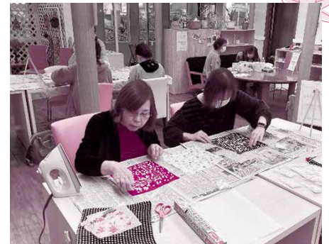
▲11/19 ふれあいカフェ2023 (みつろうエコラップづくり体験)