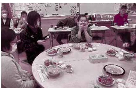
▲12/22 ほのぼのホーム クリスマス会（参加22名）