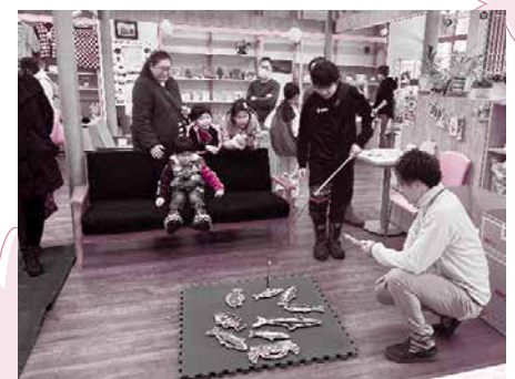
▲1/20 ふれあいカフェ2023 (ミニ縁日：つりっこゲーム)