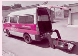
ニッサン キャラバン (車イス1台+8人乗車)