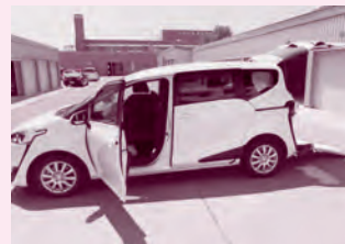
トヨタ シエンタ (車イス1台+2名乗車)