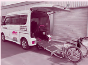
スズキ エブリー (車イス1台+3人乗車)