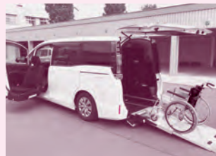
トヨタ ヴォクシー (車イス2台+3人乗車)